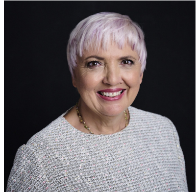
Claudia Roth MdB

die Menschen in der Ukraine verdienen nicht nur weiterhin unsere Solidarität und Unterstützung. Sie verdienen, dass wir ihnen zuhören und von ihnen lernen. Lernen, dass Freiheit heißt, sich die eigene Kultur nicht absprechen zu lassen. Dass es gilt, neben der bloßen Existenz und den wirtschaftlichen Grundlagen eines Landes auch seine Kultur zu schützen, seine Tänzer*innen, seine Schriftsteller*innen, Künstler*innen und Journalist*innen.